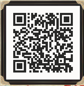
【川中島の戦い総合サイト】